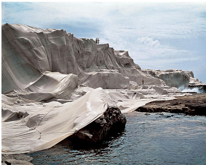
Christo, Wrapped Coast , One Million Square Feet, Little Bay, Sydney, Australia (1968-69). Photo: Wolfgang Volz © Christo 1969