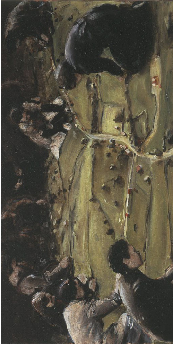
Trickland, - Part one, Mickaël Borremans.