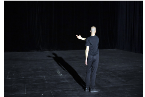
Aux lointains (2024)